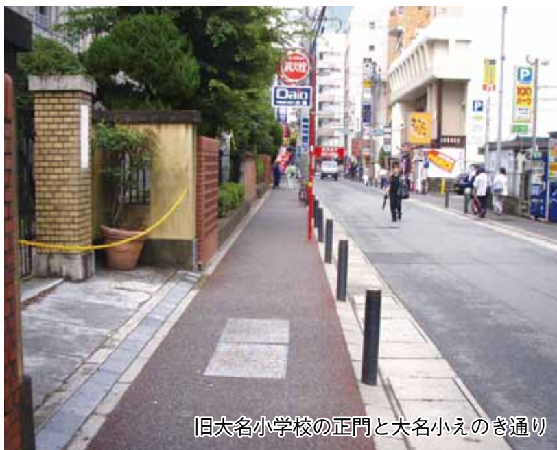
旧大名小学校の正門と大名小えのき通り

の関心をひいていました。そこに路面電車を通す計画が持ち上がり、教会との協議の結果、S字型の電車道を作ることになりました。このカーブは、運転手泣かせの難所で有名だったそうです。